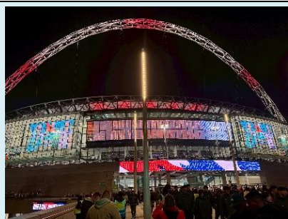
ウエンブレースタジアム サッカーの聖地(イングランド)