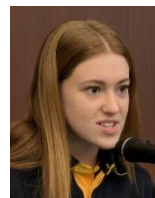
オークリーさんから一言ご挨拶