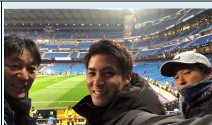
大塚監督と (スペイン)