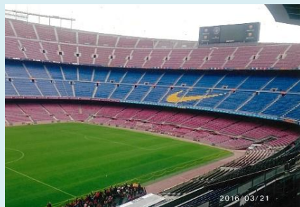
カンプ・ノウサッカースタジアム (スペイン)