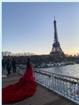
セーヌ川と エッフェル塔 (パリ)