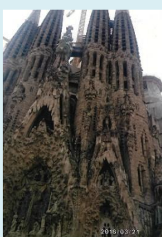
サクラダファミリア (スペイン)