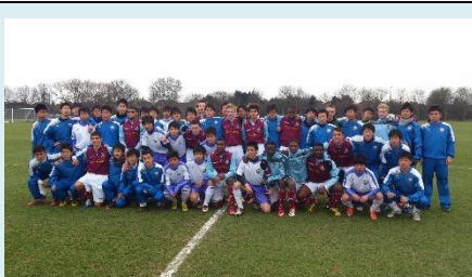
富山第一高校 プレミアムユースチームとの試合 (イングランド)