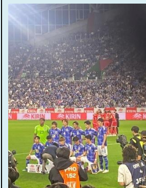
サッカー 日本代表