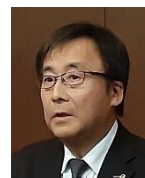
米山功労者第6回マルチプルの 打出会員