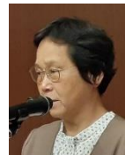
綿谷会員 皆出席表彰、おめでとうございます