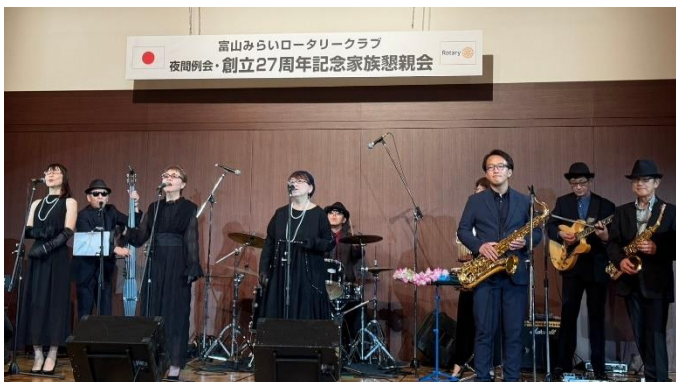
Doo-Wop 系バンド Shangri-La による演奏