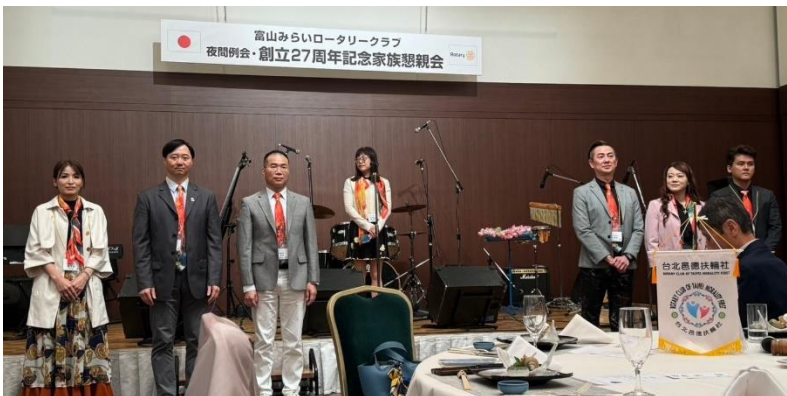
台北邑徳クラブの皆様