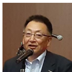
森口会長エレクト 中締め挨拶