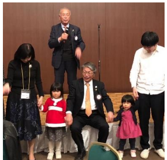
親睦委員会の皆様、お疲れ様でした