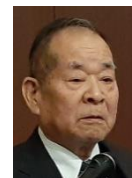
中三川会員より 退会の挨拶