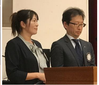
司会、お疲れ様でした