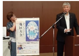
野々市クラブより地区大会のPR