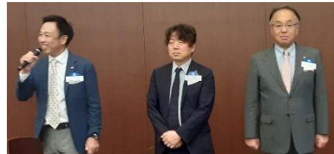
横浜MM21クラブの皆様