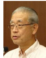
橋本会員 皆出席表彰