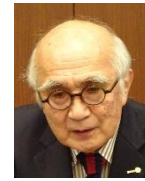
林和夫会員 米山功労者表彰、おめでとうございます