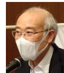
奥様の誕生日祝で 一言(住澤会員)