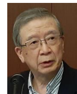
皆出席表彰 おめでとうございます