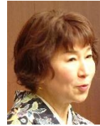
米山奨学生カウンセラー お疲れ様でした