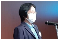
進行の 綿谷会員増強・選考・分類・出席委員長

具体的にどういった方に会員になってほしいかを各テーブルで語り合い、発表していただきました。