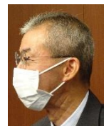
皆出席表彰の押田会員(左)と上野会員