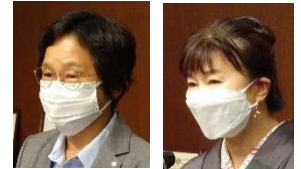
皆出席表彰 おめでとうございます