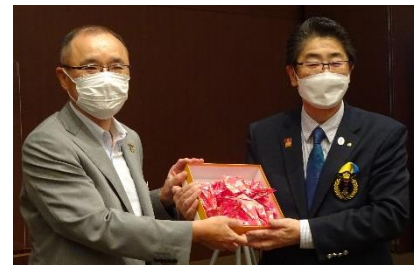
黒川ガバナーへ 折り鶴をお渡ししました