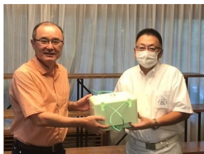
優勝は森口会員でした