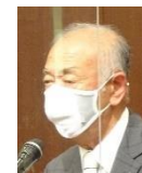
地区大会特別表彰 おめでとうございます