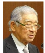
中尾特別代表より 一言いただきました