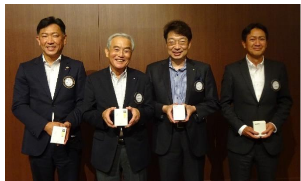
バッジ交換を終えて