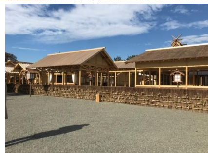
四柱神社 二見浦・夫婦岩 伊勢神宮・荒祭宮 神武天皇陵 大國主命 一般参賀 大嘗宮