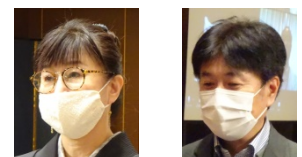
ポール・ハリス・フェロー表彰 おめでとうございます