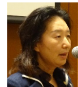
米山功労者表彰の 平木会員