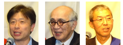
誕生日祝い おめでとうございます