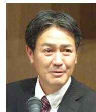
進行は牛島会員増強・選考・ 分類・出席委員長