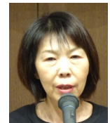
皆出席表彰の 押川会員