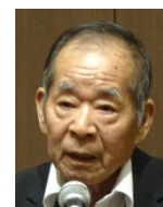
退会挨拶 中三川会員