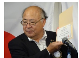
20回目の米山功労クラブです