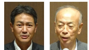
奥様の誕生日祝、おめでとうございます