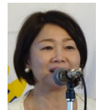
誕生日祝の 水上会員