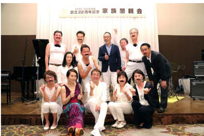
親睦委員会の皆様、お疲れ様でございました