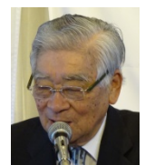
中尾特別代表より一言頂きました