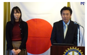
富山市スポーツ推進委員協議会よりご挨拶