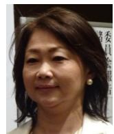
皆出席表彰の 水上会員