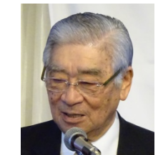
中尾特別代表より一言 いただきました