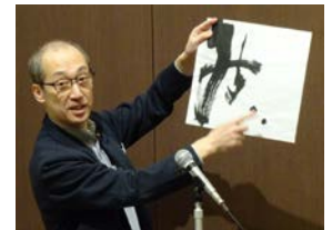
清河会員より創立20周年 記念誌の説明