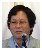
皆出席表彰の 綿谷会員