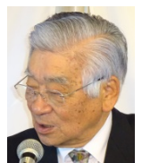
モライアさん(左)と 中尾特別代表よりご挨拶