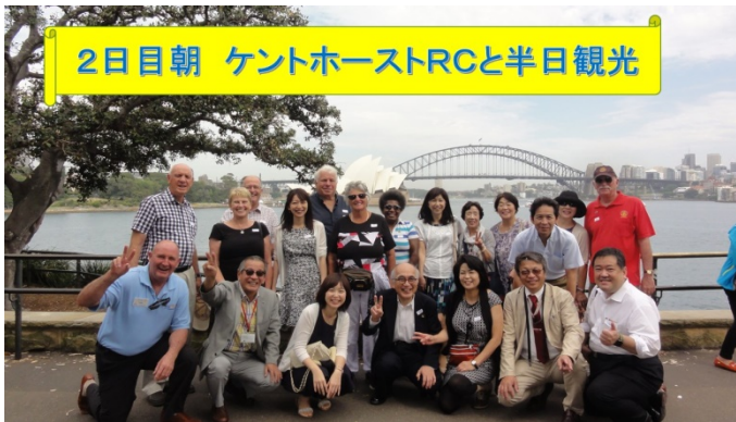
2日目朝 ケントホーストRCと半日観光