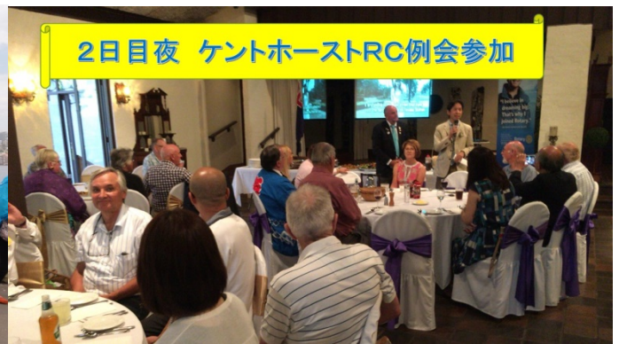
2日目夜 ケントホーストRC例会参加