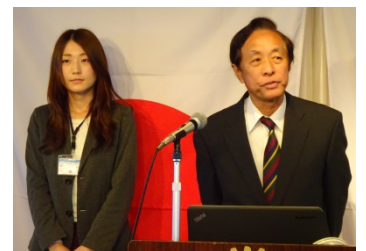
富山市スポーツ推進委員協議会よりご挨拶