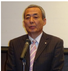
翠田・創立20周年 実行委員長よりご挨拶

今回は、富山第二分区RCの会員の皆様にもご参加いただき、制作現場の裏側など興味深いお話を聞くことができました。