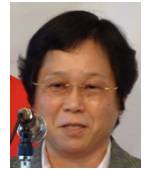
皆出席表彰の 綿谷会員